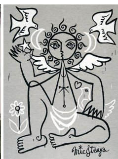
月星太陽 / ミック・イタヤ

イベント EVENT スペシャルトークショー ミック・イタヤ × 工芸士 3月21日(水・祝) 14:00~ テーマ「茨城伝統工芸の今と未来」次世代の工芸士と未来について語ります。