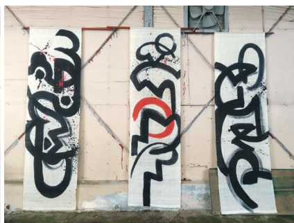
水海道染色村 きぬの染 / 石山 修