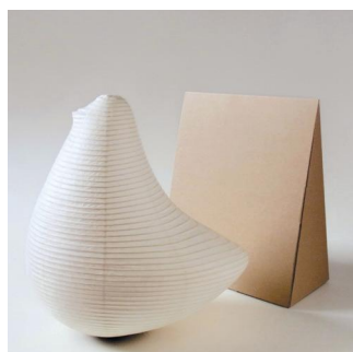
水府提灯 / 鈴木茂兵衛商店 × ミック・イタヤ