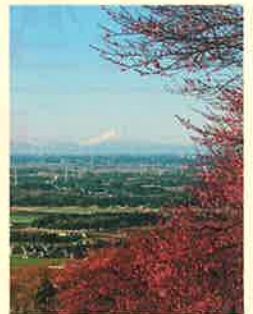
筑波山梅林から見た富士山

筑波山梅まつりは、筑波山中腹(標高約250m)の筑波山梅林で開催しています。期間中は、梅茶の無料サービスや筑波山名物がまの油売り口上などがお楽しみいただけます。園内には、紅梅・白梅・緑がく梅など約1000本もの梅が植えられており早咲きの紅梅は1月から咲き始めます。眼下には、山麓の田園風景や研究学園都市の街並み、遠くには富士山や都心の高層ビル群まで見渡すことができます。