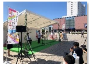
▲「いばらき秋季観光キャンペーンオープニングセレモニー」の様子