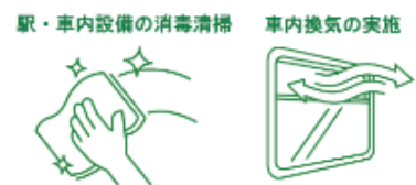
(JR東日本グループの取組みの一例)

茨城県とJR東日本水戸支社は、お客さまに安心して茨城を訪れていただくために、新型コロナウイルス感染拡大防止に向けた取組みを実施しています。 詳細については、茨城県およびJR東日本のホームページをご覧ください。