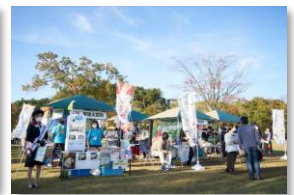
▲IBARAKI CAMP AUTUMN FESTA 2021の様子