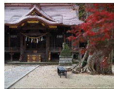
▲素鷲神社(小美玉市)