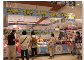
▲過去実施のPRイベント