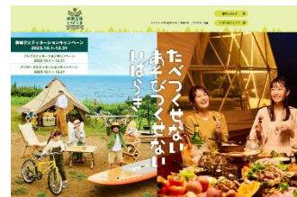
▲茨城 DC 特設ポータルサイト