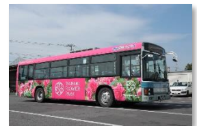
(写真はイメージです)