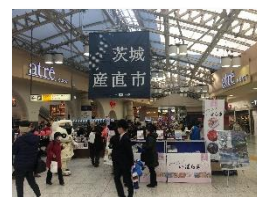
▲過去実施の産直市