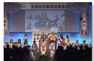
▲全国宣伝販売促進会議イメージ