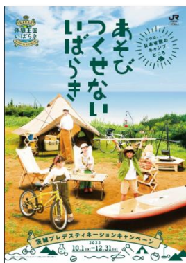
▲B1 ポスター「あそび編」