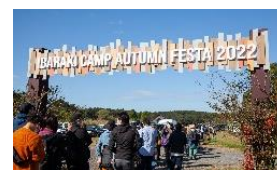
IBARAKI CAMP AUTUMN FESTA 2022の様子▲