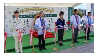
▲昨年のプレDCの様子(セレモニー)