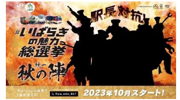
▲ティザービジュアル