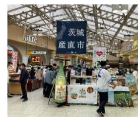
▲昨年の産直市の様子