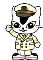
▲JR東日本水戸支社 E657系 イメージキャラクタームコナくん