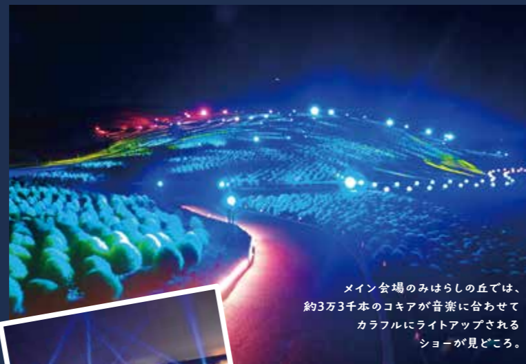
メイン会場のみはらしの丘では、約3万3千本のコキアが音楽に合わせてカラフルにライトアップされるショーが見どころ。