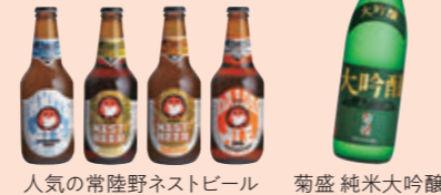
人気の常陸野ネストビール 菊盛 純米大吟醸