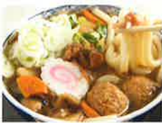
〈筑波山名物つくばうどん〉

筑波山地域ジオパークを食とツアーで楽しむ 【会場内】 『筑波山地域ジオパークの日』開催!