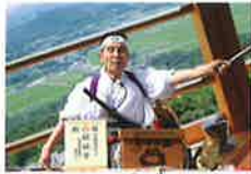
〈ガマの油売り口上〉